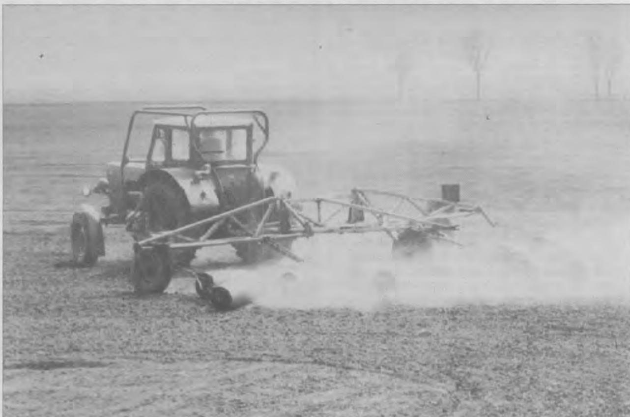
„A homokhátságon a vízgazdálkodás nem egyszerű...”