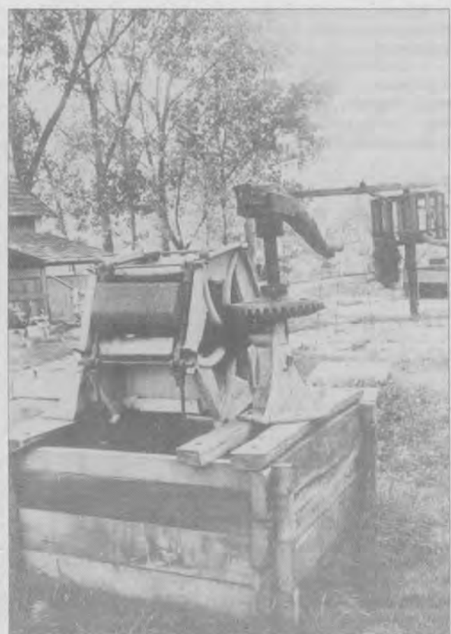
A vízügy muzeológusai ellátogattak az újszegedi emlékhelyre is