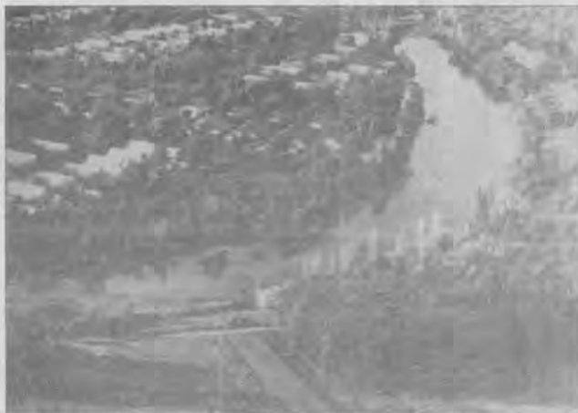
Merre kanyarodik a társulatok jövőjének útja?

A vízgazdálkodáson belül a társulati szektor működési hatékonysága sok dolgon kívül a társadalom vízügyi politikájának – és azon belül a társulati politikának – kidolgozását, majd széleskörű vitákkal annak kinemesítését, illetve alkalmazását is megkívánja. Ez utóbbi szektor csak a társulati választmányok és a szövetség részvételével, a társulati tiszt-