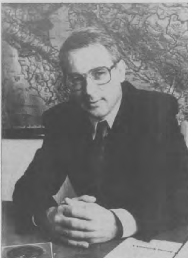
A riválist ezúttal nem távolították el...