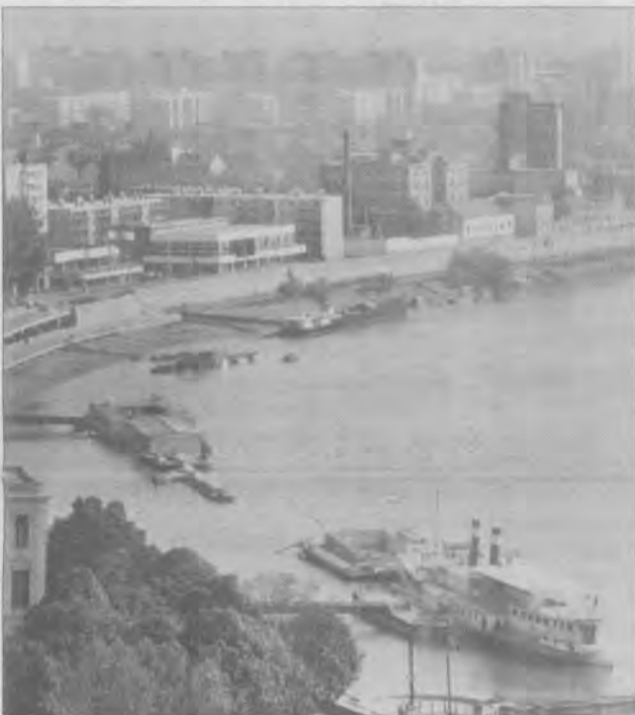
A rondella helyreállításához egy emlékvízmerce állításával kapcsolódhatnánk...

1993. október 13-a reggelén rangos rendezvényre gyülekeztek a résztvevők az Alsó-Tisza-vidéki Vízügyi Igazgatóság székházában. Esztergom, Gyula, Székesfehérvár, Szolnok, Győr, Debrecen és Miskolc után Szeged adott otthont a Magyar Vízügyi Múzeum előszervezésében az évenkénti múzeumi összekötő értekezletnek.