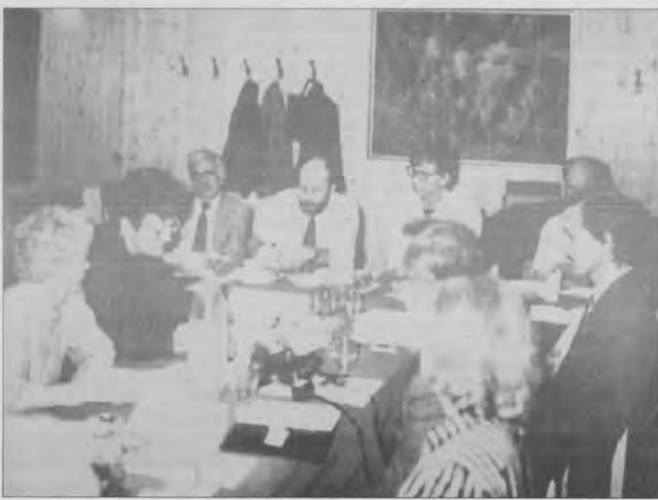
Pillanatkép a tanácskozás helyszínéről